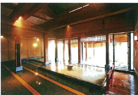
世界屈指のラジウムとラドン温泉の入浴付き